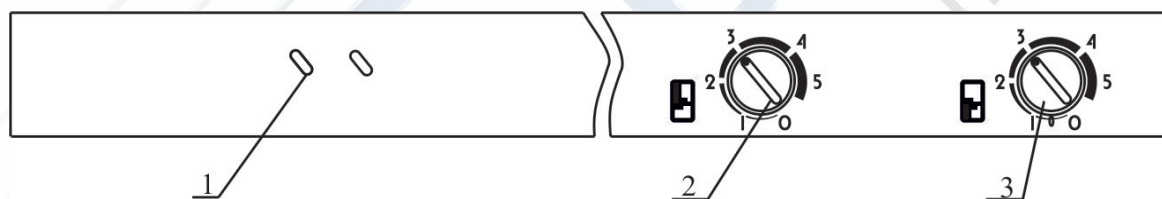
Рис.2 Схема расположения элементов управления и сигнализации

Продукты рекомендуется загружать в морозильник через 4 часа после включения. Время выхода морозильника в режим, т.е. до первой остановки компрессора, примерно 24 часов при эксплуатации морозильника в строгом соответствии с настоящим руководством по эксплуатации. В процессе эксплуатации Вы можете регулировать температуру следующим образом, для понижения температуры в морозильнике поверните ручку терморегулятора по часовой стрелке, для повышения – против часовой стрелки.